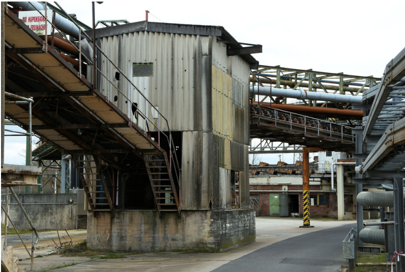
Kraftwerk Frimmersdorf II: Ascheturm 2, Eckturm für Ascheband von den Absetzbecken zum Aschefernband, Ansicht von Norden; Foto: 22.03.2023