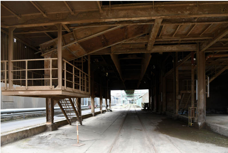
Kraftwerk Frimmersdorf II: Werkgleis in der Asche-Waggonverladung, Ansicht von Süden; Foto: 22.03.2023