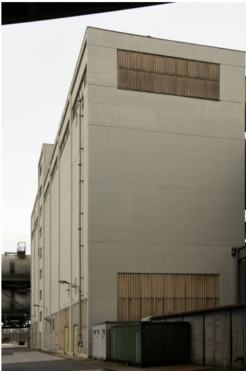
Kraftwerk Frimmersdorf II: Aschehochbunker für die Blöcke P/Q, Ansicht von Süden; Foto: 22.03.2023