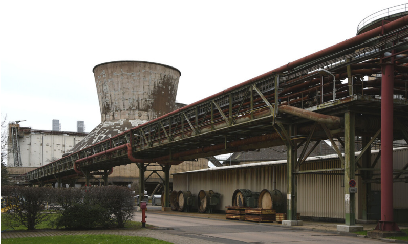
Kraftwerk Frimmersdorf II: Rohrbrücke zwischen dem Kesselhaus Block A und dem Aschehochbunker A/O, Ansicht von Südosten; Foto: 22.03.2023