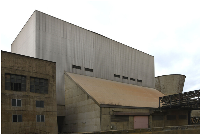
Kraftwerk Frimmersdorf II: Gipsbunker, Ansicht von Südosten; Foto: 22.03.2023