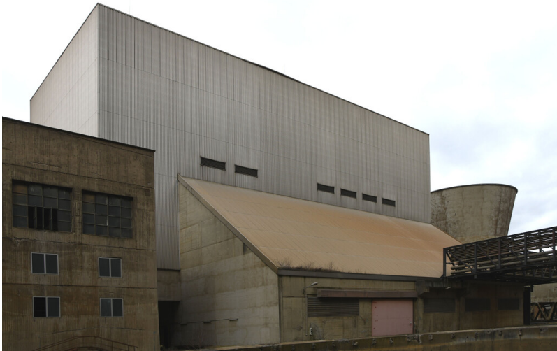
Kraftwerk Frimmersdorf II: Gipsbunker, Ansicht von Südosten