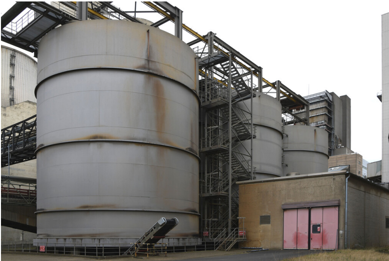
Kraftwerk Frimmersdorf II: Auffangbehälter für den Fall einer Störung in der REA der Blöcke P/Q, Ansicht von Westen; Foto: 22.03.2023