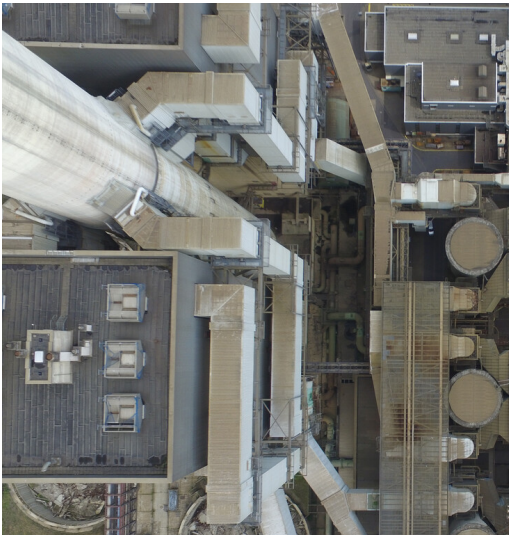
Kraftwerk Frimmersdorf II: Reingaseinleitungen in REA-Kamin 3, Ansicht Drohnenüberflug-Foto; Foto: Juli 2017 Fotograf/Urheber: RWE Power AG