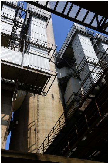
Kraftwerk Frimmersdorf II: Reingaseinleitung in REA-Kamin 1, rechts von Wäschergebäudeteil E/F, Ansicht von Südosten; Foto: 23.06.2023