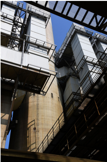
Kraftwerk Frimmersdorf II: Reingaseinleitung in REA-Kamin 1, rechts von Wäschergebäudeteil E/F, Ansicht von Südosten; Foto: 23.06.2023