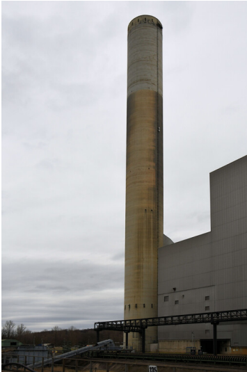
Kraftwerk Frimmersdorf II: REA-Kamin für Block P (auch Bypass-Kamin für Block Q), Ansicht von Südwesten; Foto: 22.03.2023