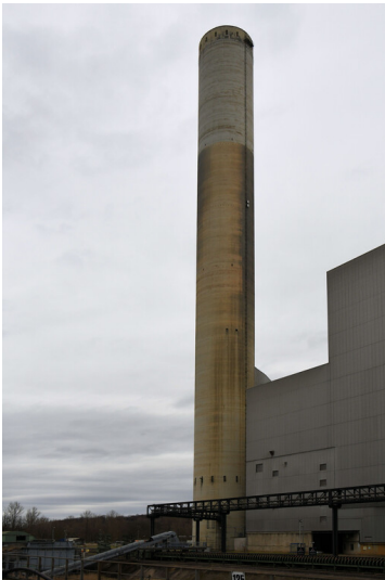
Kraftwerk Frimmersdorf II: REA-Kamin für Block P (auch Bypass-Kamin für Block Q), Ansicht von Südwesten; Foto: 22.03.2023