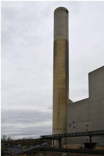
Kraftwerk Frimmersdorf II: REA-Kamin für Block P (auch Bypass-Kamin für Block Q), Ansicht von Südwesten; Foto: 22.03.2023