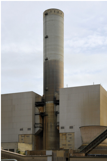
Kraftwerk Frimmersdorf II: REA-Kamin 1 für die REA-Anlagen der Blöcke C/D und E/F, Ansicht von Westen; Foto: 22.03.2023