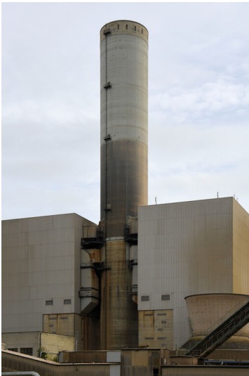
Kraftwerk Frimmersdorf II: REA-Kamin 1 für die REA-Anlagen der Blöcke C/D und E/F, Ansicht von Westen; Foto: 22.03.2023