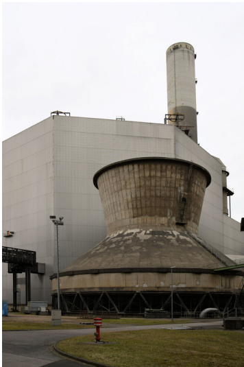
Kraftwerk Frimmersdorf II: REA-Wäschergebäude für die Blöcke P/Q, davor Ventilator-Kühlturm P2, Ansicht von Südosten; Foto: 22.03.2023