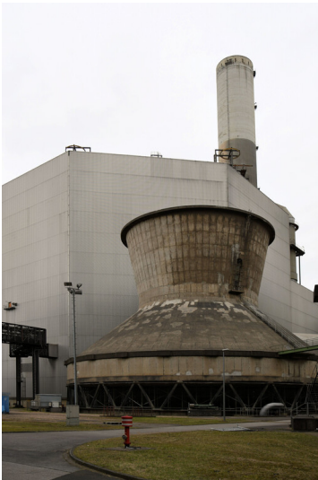
Kraftwerk Frimmersdorf II: REA-Wäschergebäude für die Blöcke P/Q, davor Ventilator-Kühlturm P2, Ansicht von Südosten