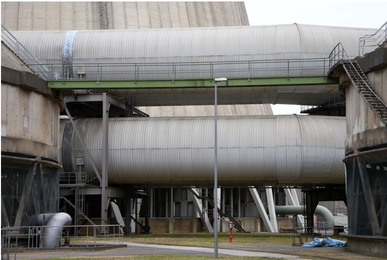
Kraftwerk Frimmersdorf II: Rauchgasreinigung, Rohgasrohre Blöcke P und Q, Ansicht von Süden