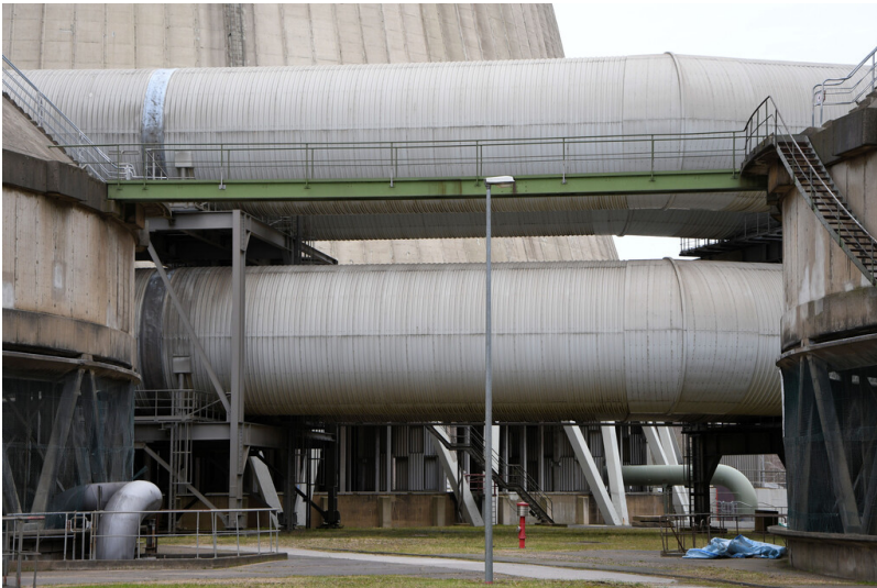
Kraftwerk Frimmersdorf II: Rauchgasreinigung, Rohgasrohre Blöcke P und Q, Ansicht von Süden