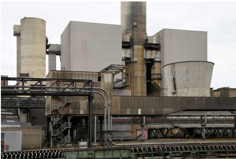
Kraftwerk Frimmersdorf II: REA-Wäschergebäude L/M (rechts) und N/O (links), Ansicht von Nordwesten; Foto: 22.03.2023