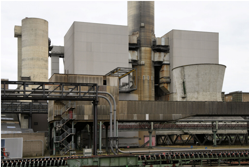
Kraftwerk Frimmersdorf II: REA-Wäschergebäude L/M (rechts) und N/O (links), Ansicht von Nordwesten