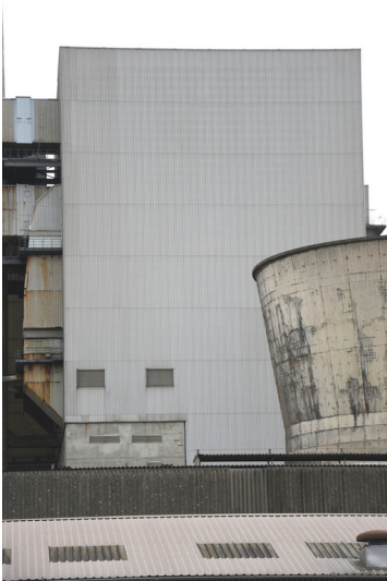
Kraftwerk Frimmersdorf II: REA-Gebäude L/M, Ansicht von Westen; Foto: 22.03.2023