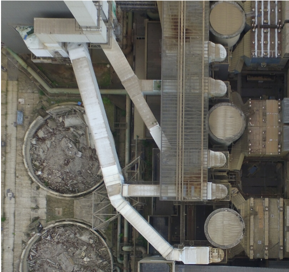
Kraftwerk Frimmersdorf II: Rohgaskanäle Blöcke L (unten) und M (Mitte), Einleitung ins Wäschergebäude L/M, Ansicht Drohnenüberflug-Foto; Foto: Juli 2017