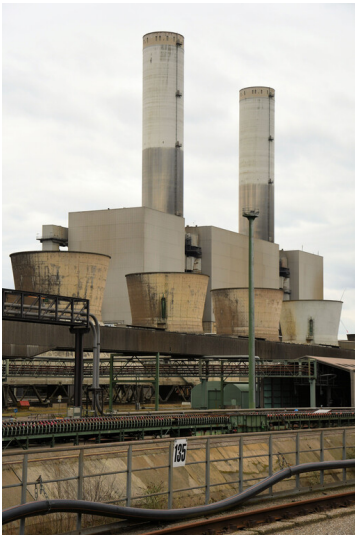
Kraftwerk Frimmersdorf II: REA-Wäschergebäude für die Blöcke J/K (links), Ansicht von Nordwesten