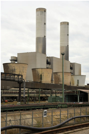
Kraftwerk Frimmersdorf II: REA-Wäschergebäude für die Blöcke J/K (links), Ansicht von Nordwesten; Foto: 22.03.2023