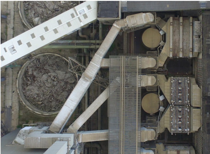
Kraftwerk Frimmersdorf II: Rohgaskanäle Blöcke J (unten) und K (oben), Einleitung ins Wäschergebäude J/K, Ansicht Drohnenüberflug-Foto; Foto: Juli 2017 Fotograf/Urheber: RWE Power AG