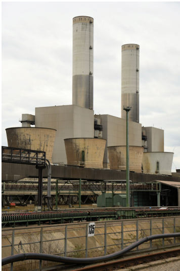
Kraftwerk Frimmersdorf II: REA-Wäschergebäude für die Blöcke E/F und G/H (Mitte), Ansicht von Nordwesten; Foto: 22.03.2023