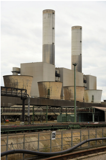
Kraftwerk Frimmersdorf II: REA-Wäschergebäude für die Blöcke E/F und G/H (Mitte), Ansicht von Nordwesten; Foto: 22.03.2023