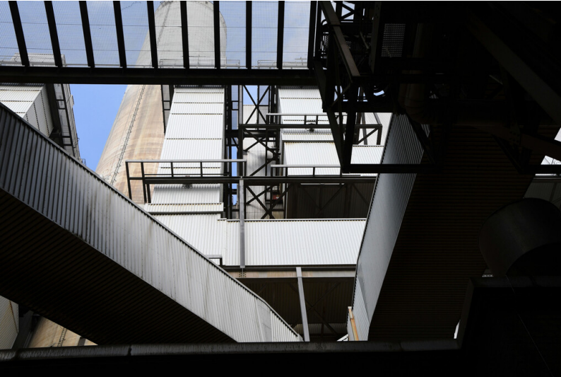
Kraftwerk Frimmersdorf II: Rohgaskanäle Blöcke E und F vor Kamin 1 und Wäschergebäude E/F/G/H, Ansicht von Osten