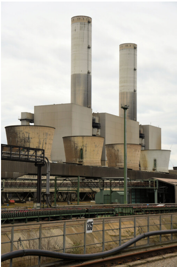
Kraftwerk Frimmersdorf II: REA-Wäschergebäude für die Blöcke C/D (rechts), Ansicht von Nordwesten; Foto: 22.03.2023