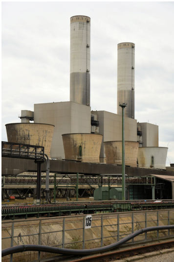
Kraftwerk Frimmersdorf II: REA-Wäschergebäude für die Blöcke C/D (rechts), Ansicht von Nordwesten; Foto: 22.03.2023