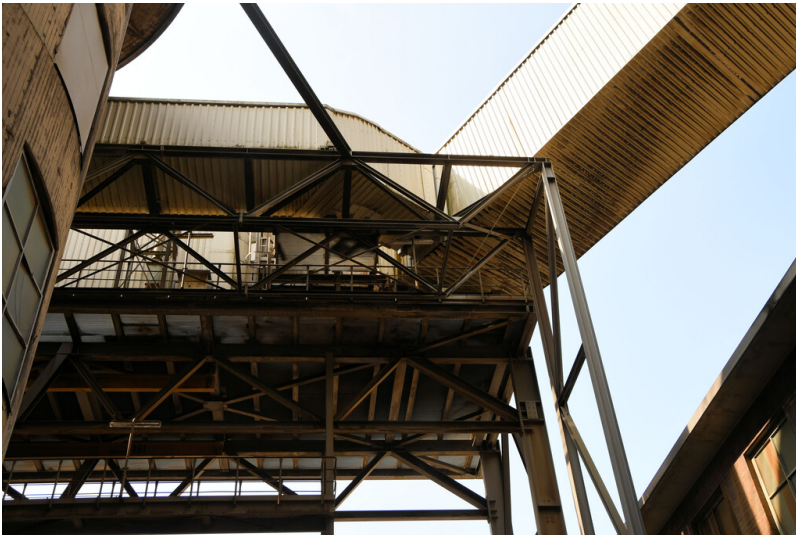
Kraftwerk Frimmersdorf II: Rohgaskanal Block C, Ansicht von Norden; Foto: 23.06.2023