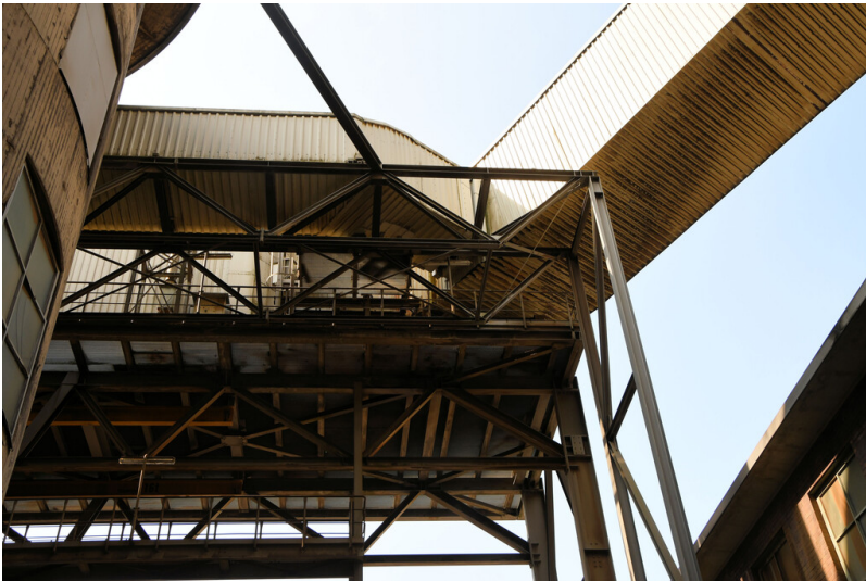
Kraftwerk Frimmersdorf II: Rohgaskanal Block C, Ansicht von Norden; Foto: 23.06.2023