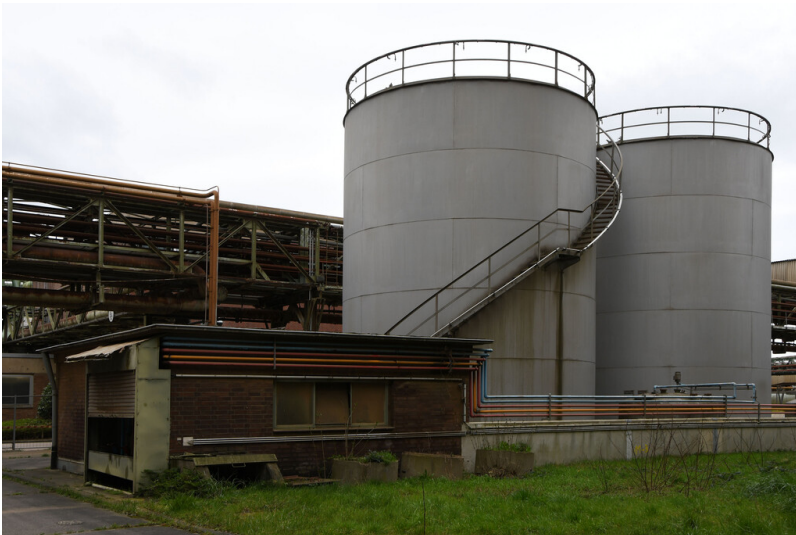
Kraftwerk Frimmersdorf II: Zündölanlage, Zündöltanks, Ansicht von Nordosten