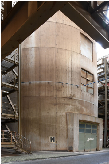
Kraftwerk Frimmersdorf II: Schornstein-Fundamentsockel Block N, Ansicht von Nordwesten; Foto: 21.03.2023