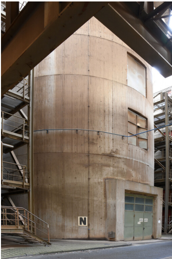
Kraftwerk Frimmersdorf II: Schornstein-Fundamentsockel Block N, Ansicht von Nordwesten