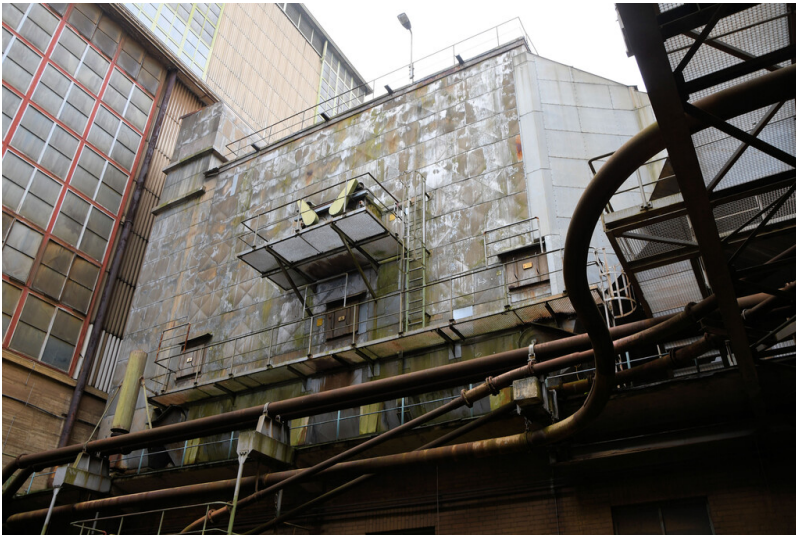
Kraftwerk Frimmersdorf II: Elektrofilter Block N, Ansicht von Norden; Foto: 23.06.2023