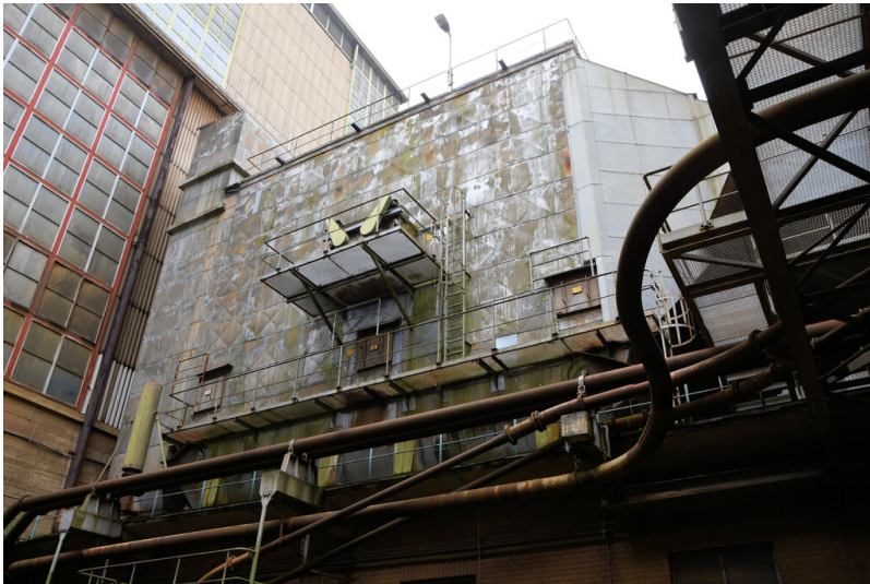
Kraftwerk Frimmersdorf II: Elektrofilter Block N, Ansicht von Norden