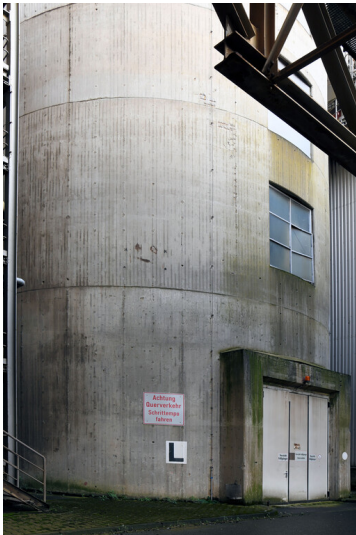
Kraftwerk Frimmersdorf II: Schornstein-Fundamentsockel Block L, Ansicht von Nordwesten; Foto: 21.03.2023