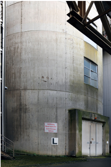
Kraftwerk Frimmersdorf II: Schornstein-Fundamentsockel Block L, Ansicht von Nordwesten; Foto: 21.03.2023