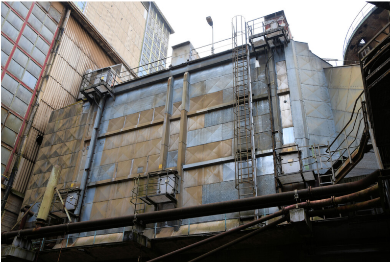
Kraftwerk Frimmersdorf II: Elektrofilter Block L, Ansicht von Norden; Foto: 23.06.2023