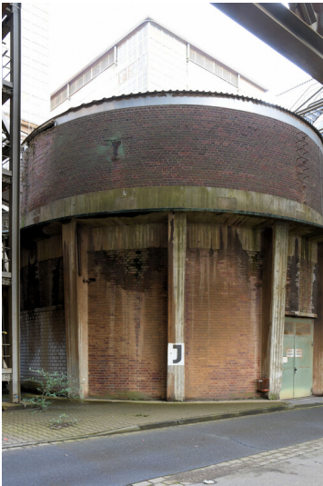
Kraftwerk Frimmersdorf II: Schornstein-Fundamentsockel Block J, Ansicht von Nordwesten; Foto: 21.03.2023