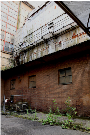
Kraftwerk Frimmersdorf II: Elektrofilter Block H, Ansicht von Norden