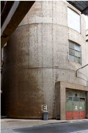
Kraftwerk Frimmersdorf II: Schornstein-Fundamentsockel Block E, Ansicht von Nordwesten; Foto: 21.03.2023