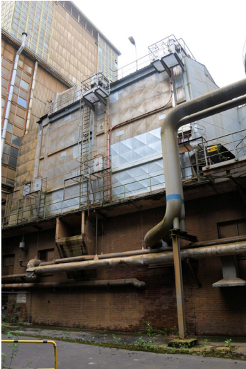
Kraftwerk Frimmersdorf II: Elektrofilter Block E, Ansicht von Norden; Foto: 23.06.2023