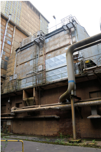
Kraftwerk Frimmersdorf II: Elektrofilter Block E, Ansicht von Norden