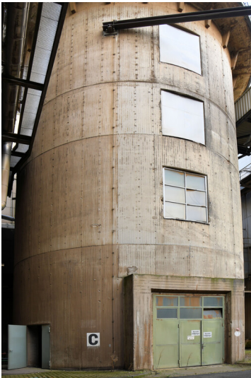
Kraftwerk Frimmersdorf II: Schornstein-Fundamentsockel Block C, Ansicht von Nordwesten; Foto: 21.03.2023