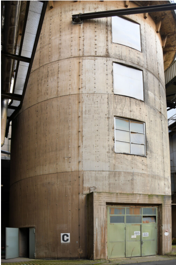
Kraftwerk Frimmersdorf II: Schornstein-Fundamentsockel Block C, Ansicht von Nordwesten