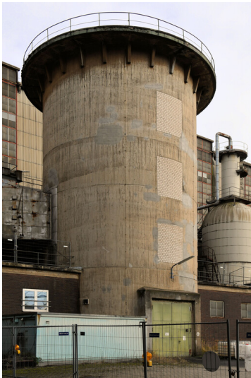
Kraftwerk Frimmersdorf II: Schornstein-Fundamentsockel Block B, Ansicht von Nordwesten