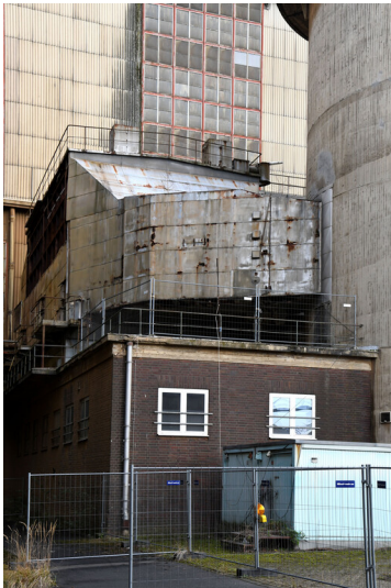
Kraftwerk Frimmersdorf II: Elektrofilter Block B, Rauchgaseinleitung in ehemaligen Schornstein B, Ansicht von Nordwesten; Foto: 21.03.2023