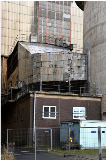
Kraftwerk Frimmersdorf II: Elektrofilter Block B, Rauchgaseinleitung in ehemaligen Schornstein B, Ansicht von Nordwesten; Foto: 21.03.2023