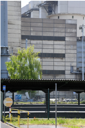
Kraftwerk Frimmersdorf II: Luvo-Schwerbau Block Q, Ansicht von Norden