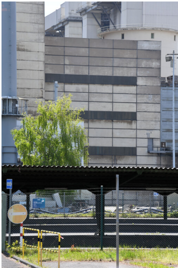
Kraftwerk Frimmersdorf II: Luvo-Schwerbau Block Q, Ansicht von Norden; Foto: 04.05.2023