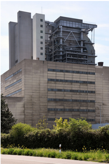
Kraftwerk Frimmersdorf II: Kesselhaus Block Q, Ansicht von Nordosten; Foto: 04.05.2023