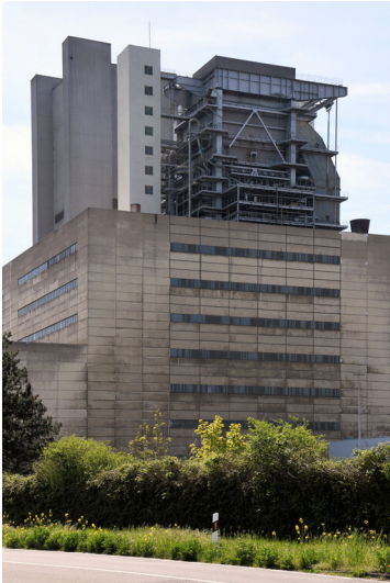
Kraftwerk Frimmersdorf II: Kesselhaus Block Q, Ansicht von Nordosten