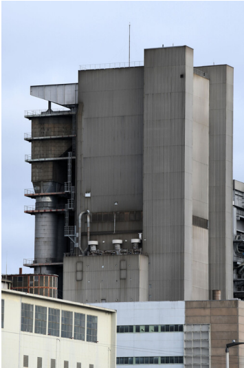
Kraftwerk Frimmersdorf II: Kesselhaus Block P, Ansicht von Süden; Foto: 22.03.2023