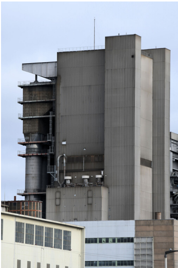
Kraftwerk Frimmersdorf II: Kesselhaus Block P, Ansicht von Süden