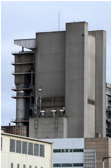
Kraftwerk Frimmersdorf II: Kesselhaus Block P, Ansicht von Süden; Foto: 22.03.2023