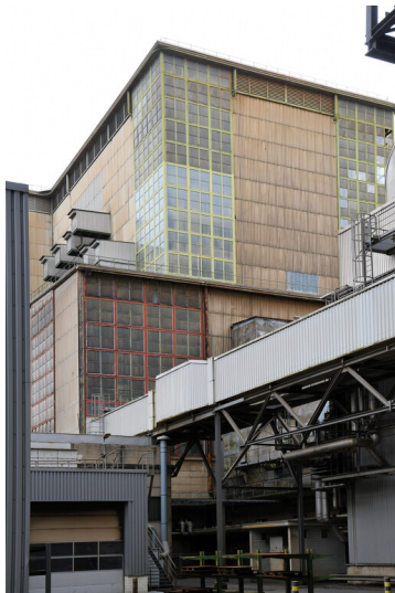
Kraftwerk Frimmersdorf II: Kesselhaus Block O, Ansicht von Nordwesten; Foto: 22.03.2023