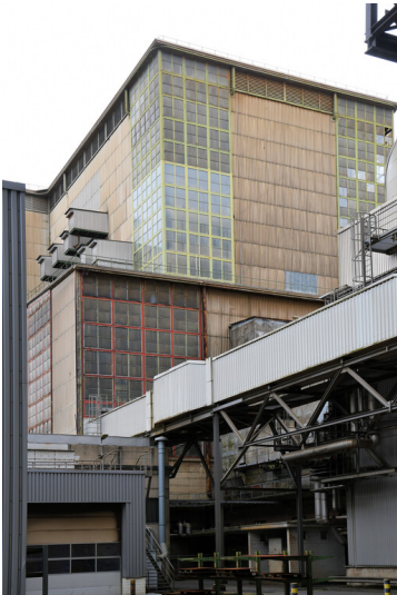
Kraftwerk Frimmersdorf II: Kesselhaus Block O, Ansicht von Nordwesten; Foto: 22.03.2023