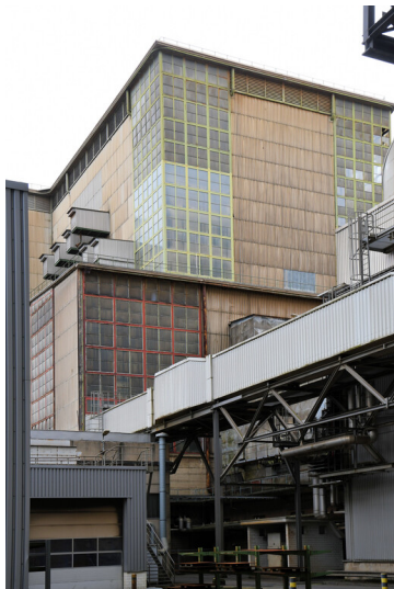
Kraftwerk Frimmersdorf II: Kesselhaus Block O, Ansicht von Nordwesten; Foto: 22.03.2023