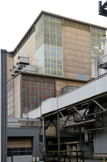
Kraftwerk Frimmersdorf II: Kesselhaus Block O, Ansicht von Nordwesten