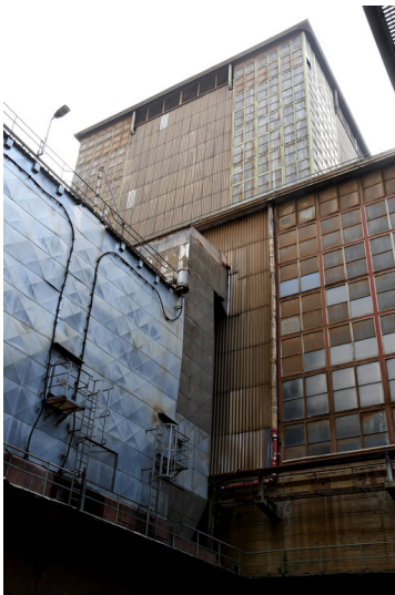
Kraftwerk Frimmersdorf II: Kesselhaus Block F, Ansicht von Westen; Foto: 23.06.2023