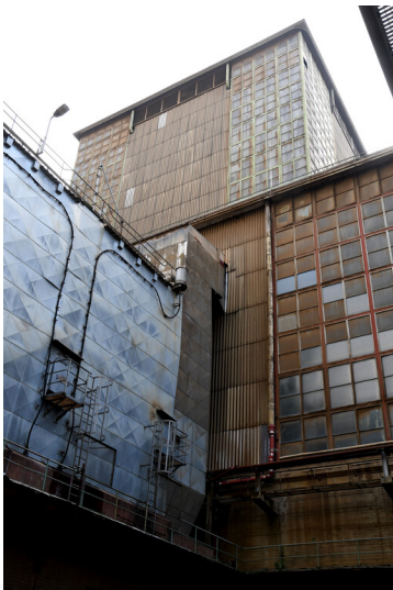
Kraftwerk Frimmersdorf II: Kesselhaus Block F, Ansicht von Westen