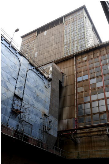
Kraftwerk Frimmersdorf II: Kesselhaus Block F, Ansicht von Westen