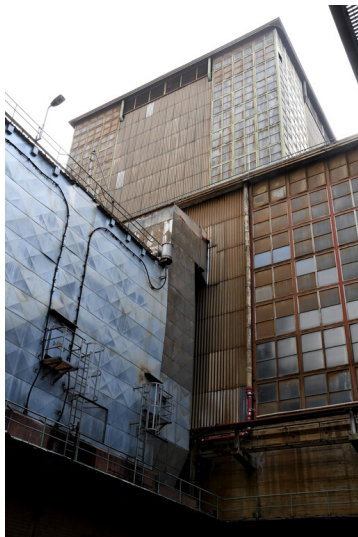
Kraftwerk Frimmersdorf II: Kesselhaus Block F, Ansicht von Westen; Foto: 23.06.2023