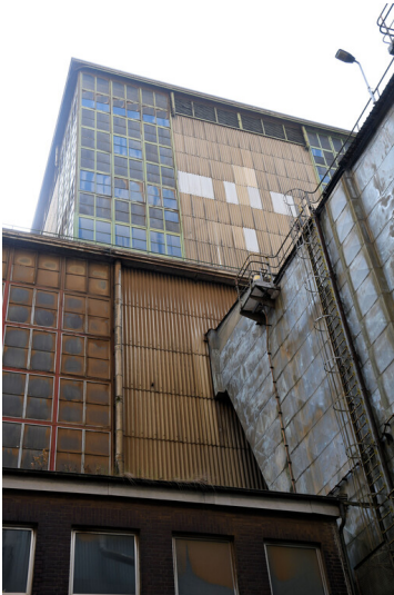
Kraftwerk Frimmersdorf II: Kesselhaus Block D, Ansicht von Nordwesten; Foto: 23.06.2023