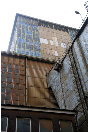
Kraftwerk Frimmersdorf II: Kesselhaus Block D, Ansicht von Nordwesten; Foto: 23.06.2023