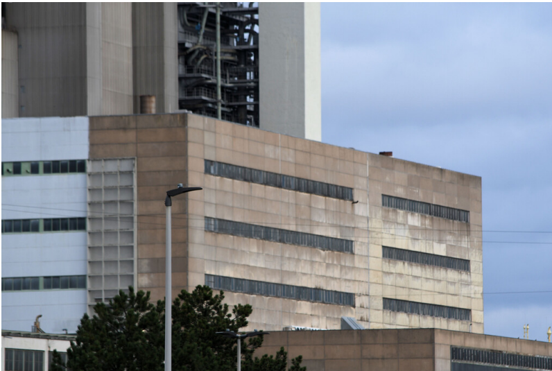
Kraftwerk Frimmersdorf II: Speisepumpen-Schwerbau Blöcke P/Q, Ansicht von Süden; Foto: 22.03.2023