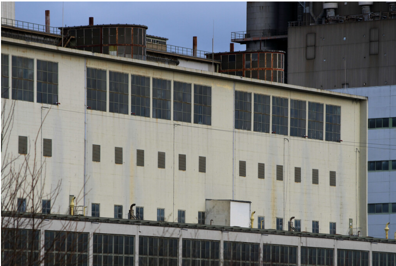
Kraftwerk Frimmersdorf II: Schwerbau Blöcke N/O, Ansicht von Südosten