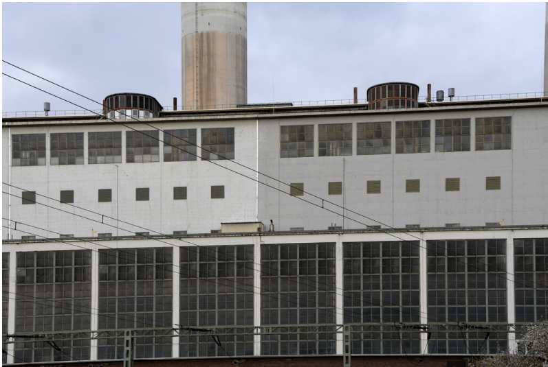
Kraftwerk Frimmersdorf II: Schwerbau Blöcke E/F, Ansicht von Osten